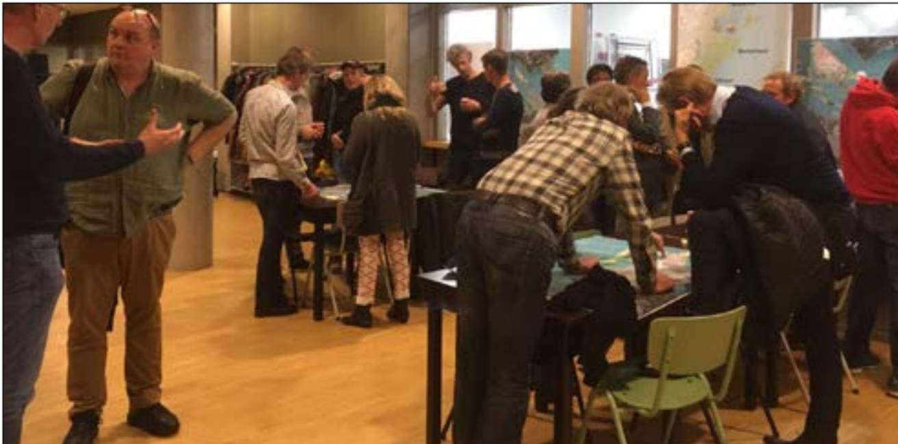
Bewonersavond 28 november 2018

Het document beschrijft de visie op het gebied, gebaseerd op de Watervisie, het oorspronkelijk ontwerp en een stedelijk en regionaal perspectief. Vervolgens wordt een typologie van het water in het plangebied, van de eilanden, de ecologie en de havens gegeven. Op grond van de visie en typologieën wordt een aantal strategische keuzes gemaakt. Daarna volgt een beschrijving van de huidige ontwikkelingen voor IJburg en Zeeburgereiland. De kaart geeft beeldend de conclusie weer van de voorliggende hoofdstukken. Tenslotte komt in het laatste hoofdstuk aan de orde hoe in de vervolgstappen na dit programma de concreet uit te voeren werkzaamheden en de noodzakelijke samenhang kunnen worden geborgd.