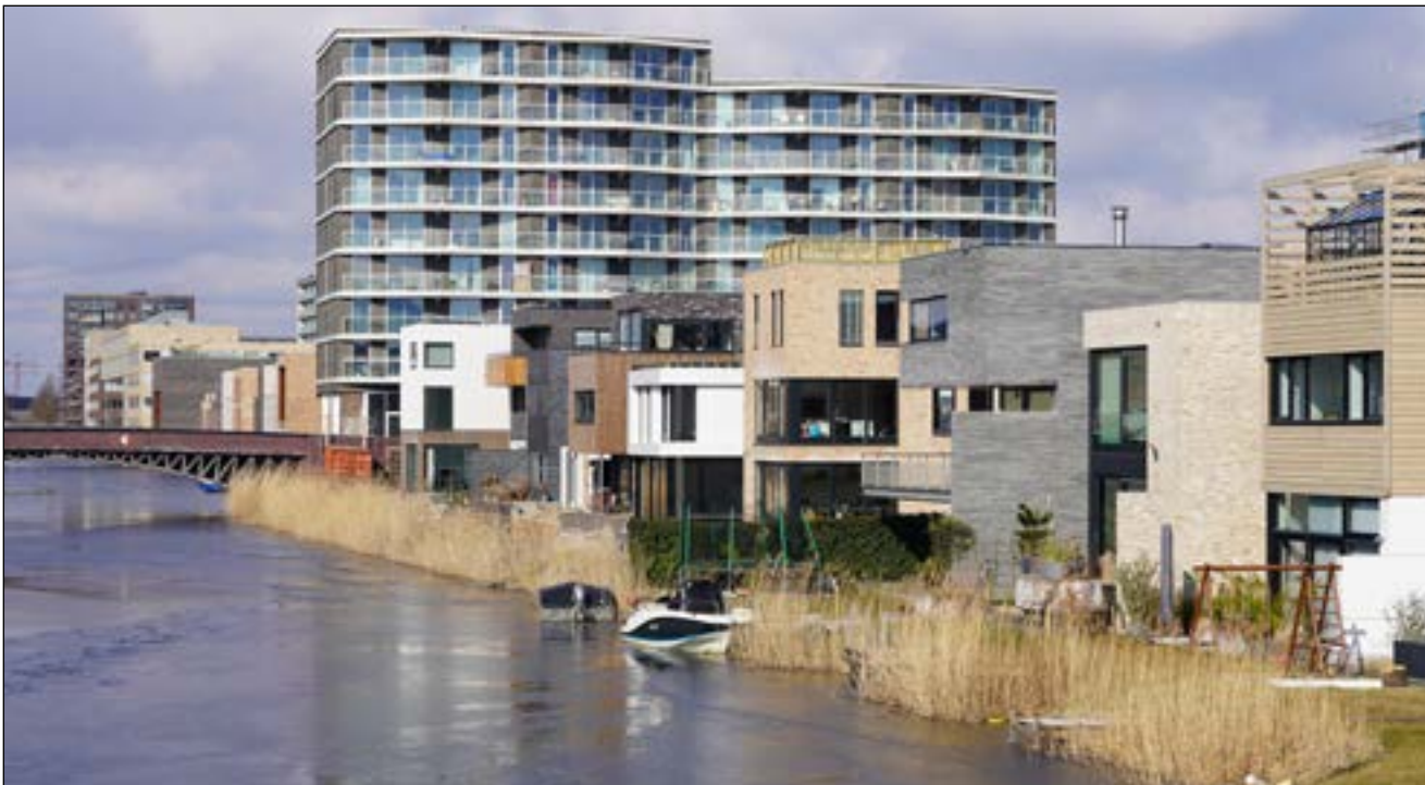
Tijdelijke inrichting oevers

Dit zijn fysieke maatregelen waar met passende ontwerp oplossingen het gebruik van het water kan worden verbeterd en geïntensiveerd. Van een andere orde, maar minstens zo belangrijk voor verbetering en intensivering, is de papieren werkelijkheid op de achtergrond. Dat gaat over het actualiseren van het buitenwaterplan voor de inrichting van de bodem. Dat gaat ook over nieuwe afspraken tussen alle verantwoordelijke partijen in een beheerconvenant en over handhaving kwesaties.