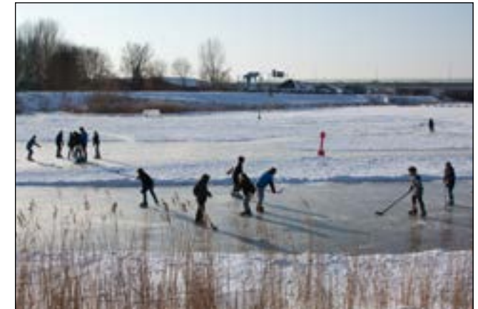
IJburg - Schaatsen

Omvang en aard van de ontwikkelingen laten een forse uitbreiding zien waarbij ook aan de ecologie een impuls is gegeven. De vraag of het op de juiste wijze en voldoende invulling geeft kan alleen positief beantwoord worden indien aan diverse randvoorwaarden wordt voldaan die zorg moeten dragen voor samenhang.