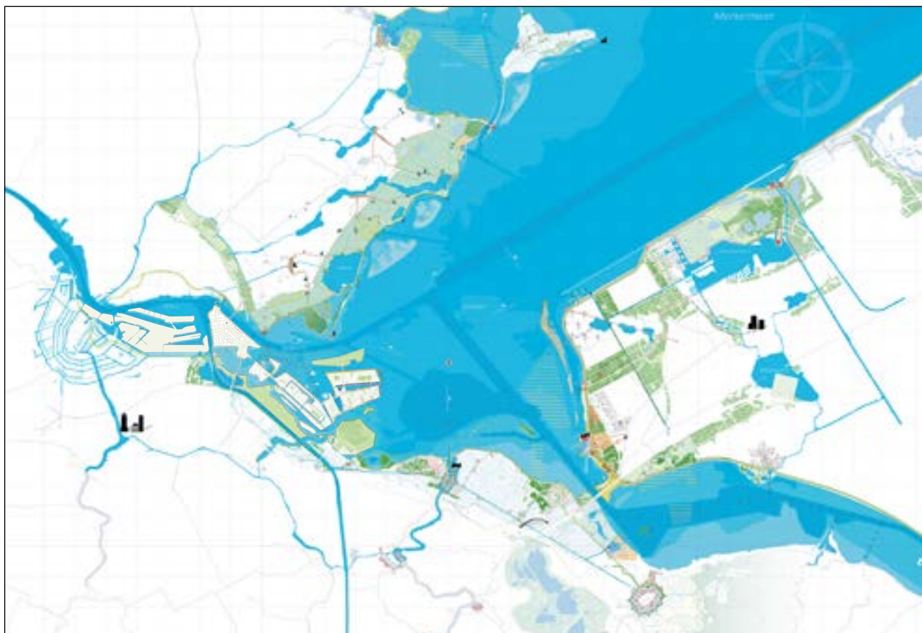
Impressie IJmeer – regionale samenwerking

Zeeburgereiland in het IJmeer vormen in die structuur de unieke blauwe scheg. In een verkenning van de koppen van de scheggen (december 2018) worden onder meer als uitgangspunten genoemd het versterken van de identiteit van het gebied en het organiseren van een integraal gebiedsproces. Ook is in 2018 in samenwerking met regionale partijen een 'levend perspectief' voor het IJmeer als centraal recreatief waterpark opgetekend. Het is geen eindbeeld, maar brengt gemeenschappelijk gesignaleerde kansen in beeld.