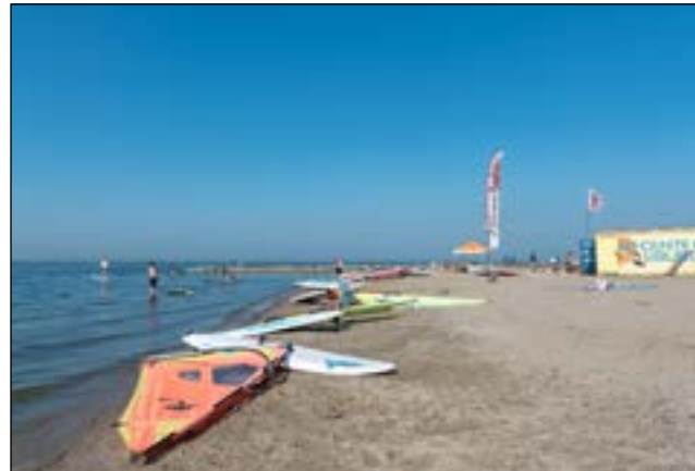
IJburg - Strand