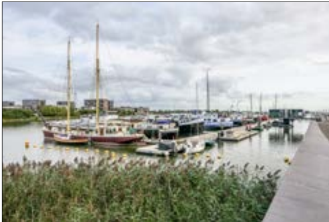
IJburg - Cas Oorthuyskade

Bijgevoegde kaart voor het programma waterrecreatie en ecologie IJburg en Zeeburgereiland geeft beeldend een eindsituatie weer volgend uit de gestelde visie, typologieën en ontwikkelingen. De vraag is of de beschreven ontwikkelingen op de juiste wijze en voldoende invulling geven aan het in de visie beschreven beeld en ambitie als hét waterrecreatiecluster van Amsterdam.