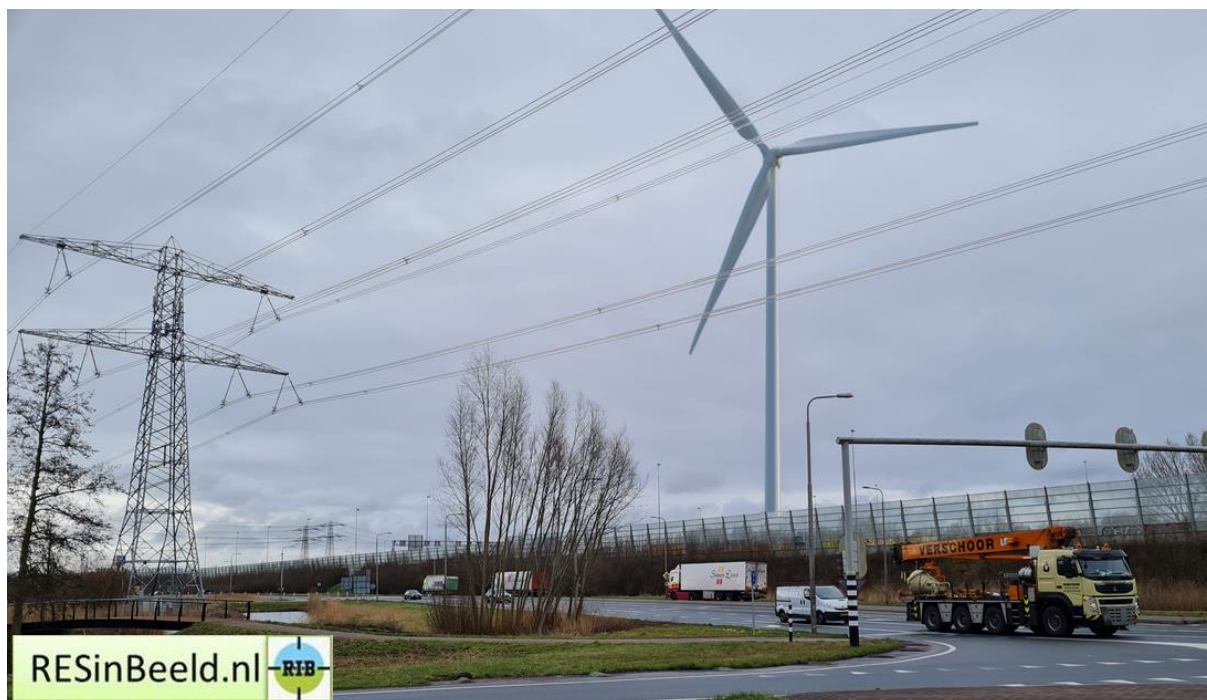
Locatie foto's met ingetekende windturbine (realistisch beeldvorming)